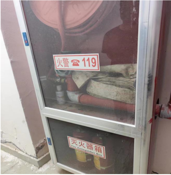
图 3-1 消防栓水管发霉