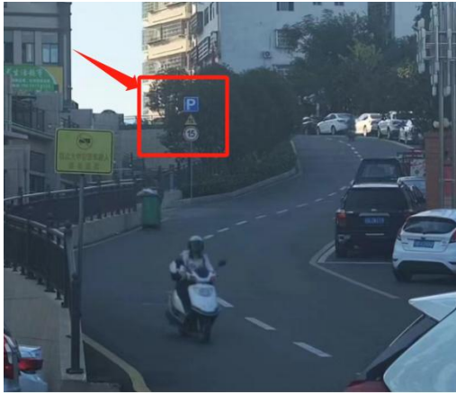
图 3-7 停车场附近有停车场 1

能提供后续运营维护方案、停车场使用方案、停车场管理制度文件； 五是项目建设单位未调查社会公众对 2022 年定南县社会停车场工程建设项目满意度。