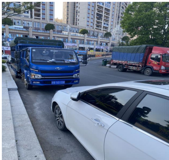
图 3-10 紧挨着停车场车辆乱停乱放