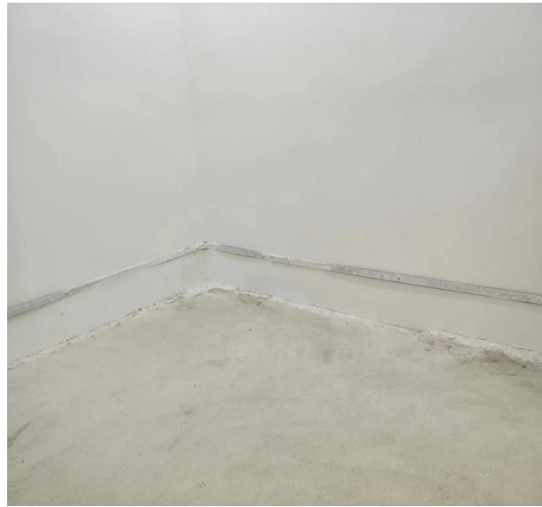
图 3-4 地下停车库墙面脱落 (2)