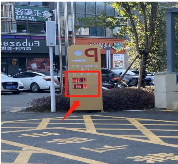
图 3-9 显示牌显示与实际情况不符