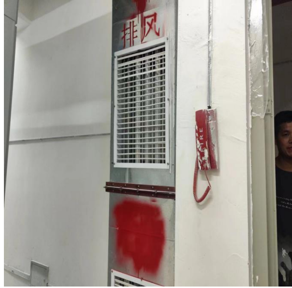
图 3-2 消防救援电话无法正常使用