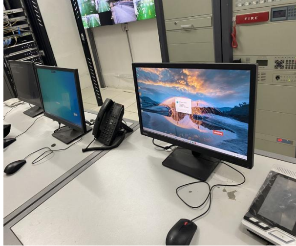
图 3-6 信息化体系控软件无法使用