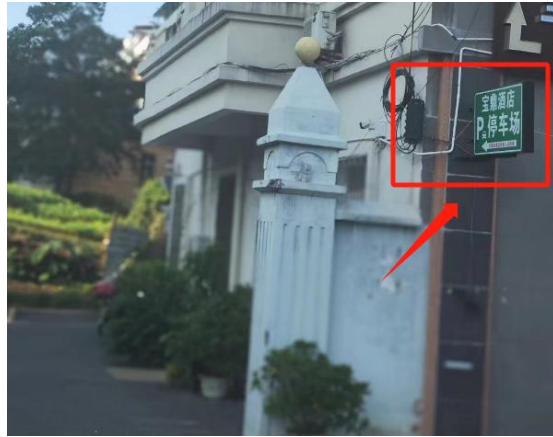
图 3-8 停车场附近有停车场 2