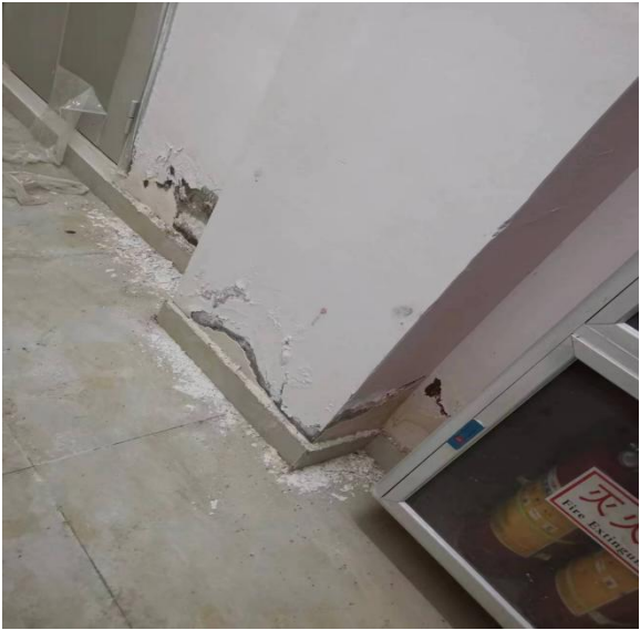
图 3-3 地下停车库墙面脱落 (1)